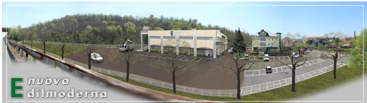
FOTOINSERIMENTO RENDERING 02 – Con alberi inverno.