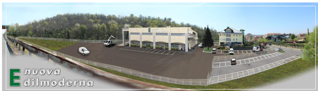
FOTOINSERIMENTO RENDERING 01 – Senza alberi