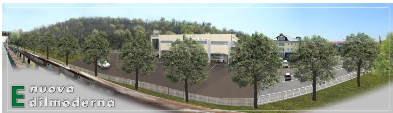
FOTOINSERIMENTO RENDERING 03 – Con alberi estate.